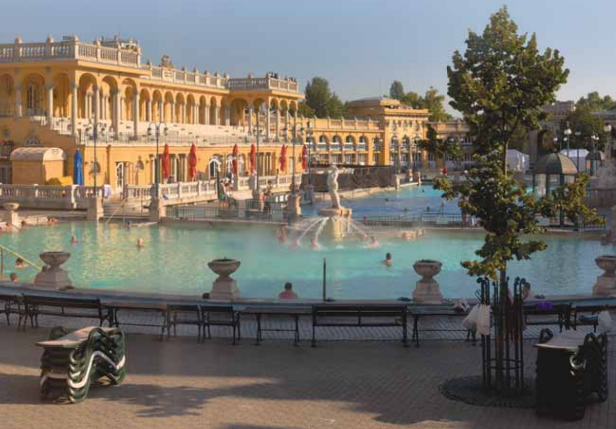
Bassins ouverts de la cour intérieure des bains Széchenyi

La température de l'eau permet de se baigner dans les bassins extérieurs même en pleine hiver. L'image emblématique des bains est les messieurs d'un certain âge jouant aux échecs sur les tables en plein milieu de l'eau.