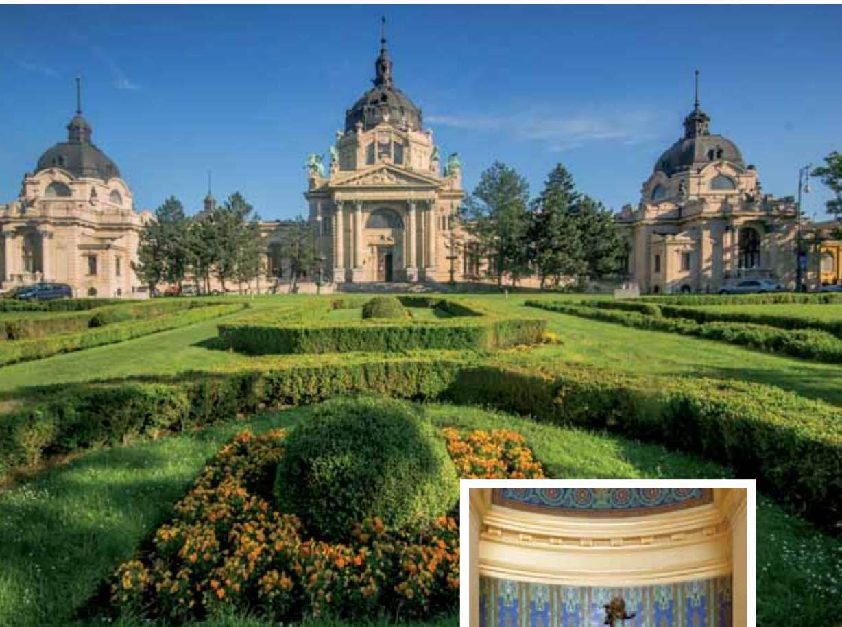
Façade centrale des bains Széchenyi séquencée de trois pavillons couverts de dôme, avec au milieu l'entrée principale