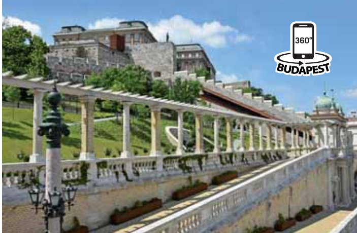
Rampe menant dans le jardin au milieu du Bazar du Jardin du Château (Várkert Bazar)

Entre 1961 et 1984 c'était un lieu-culte de concerts pop et rock. Puis, l'ensemble d'édifices en ruines fut fermé jusqu'à sa rénovation en 2014 durant laquelle on créa des espaces d'expositions, des salles d'événements, un théâtre en plein air. On a rétabli les promenades, les fontaines et le jardin néo-renaissance de 5000 m 2 rempli de plantes spéciales. Un escalier roulant est à votre disposition aussi près des marches.