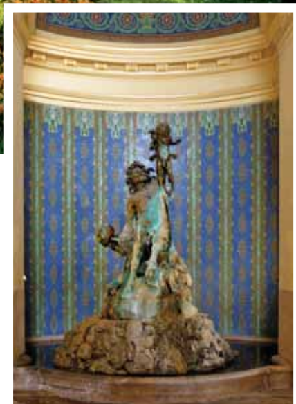
La fontaine représentant un centaure dans le hall du dôme – œuvre de József Róna

Les bains Széchenyi du Bois de Ville forment le plus grand complexe thermal d'Europe. Ils ont été construits entre 1909 et 1913 en style néo-renaissance par Győző Czigler, agrandis en 1926 par des bassins extérieurs selon les plans d'Imre Francsek. Le bâtiment des bains a été rénové entre 1998 et 2006, en y instal-