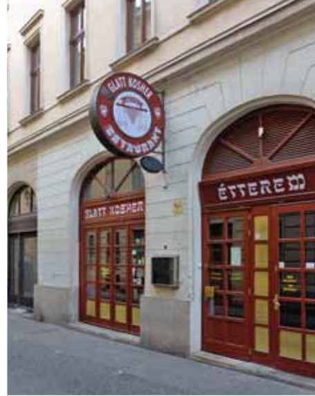
Plusieurs restaurants cashers fonctionnent toujours dans l'ancien quartier juif

La pâtisserie Fröhlich du numéro 22 de la rue Dob (utca) qui vend des pâtisseries casher