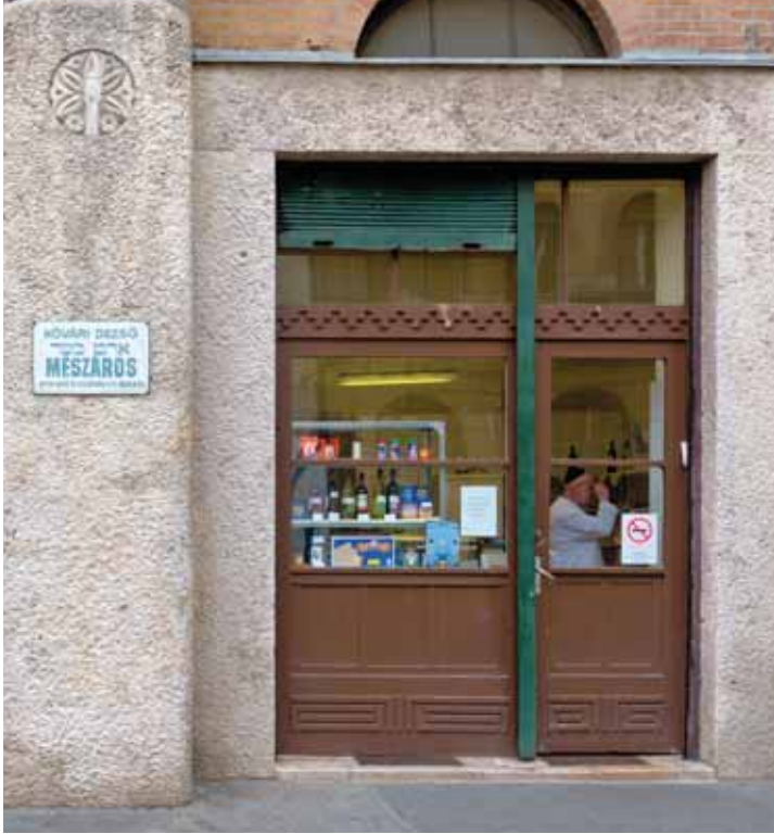
Atelier du boucher (appelé 'schachter') vendant de la viande casher